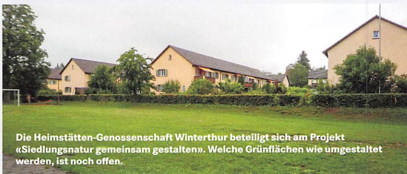
Die Heimstätten-Genossenschaft Winterthur beteiligt sich am Projekt «Siedlungsnatur gemeinsam gestalten». Welche Grünflächen wie umgestaltet werden, ist noch offen.