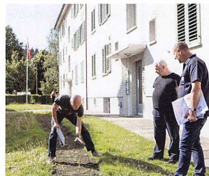
Einen guten Monat nach der Aussaat sehen die künftigen Blumenstreifen noch dürrig aus. Viele Wildblumen keimen erst nach dem ersten Überwintern. Links: Anlegen der Blumenstreifen.